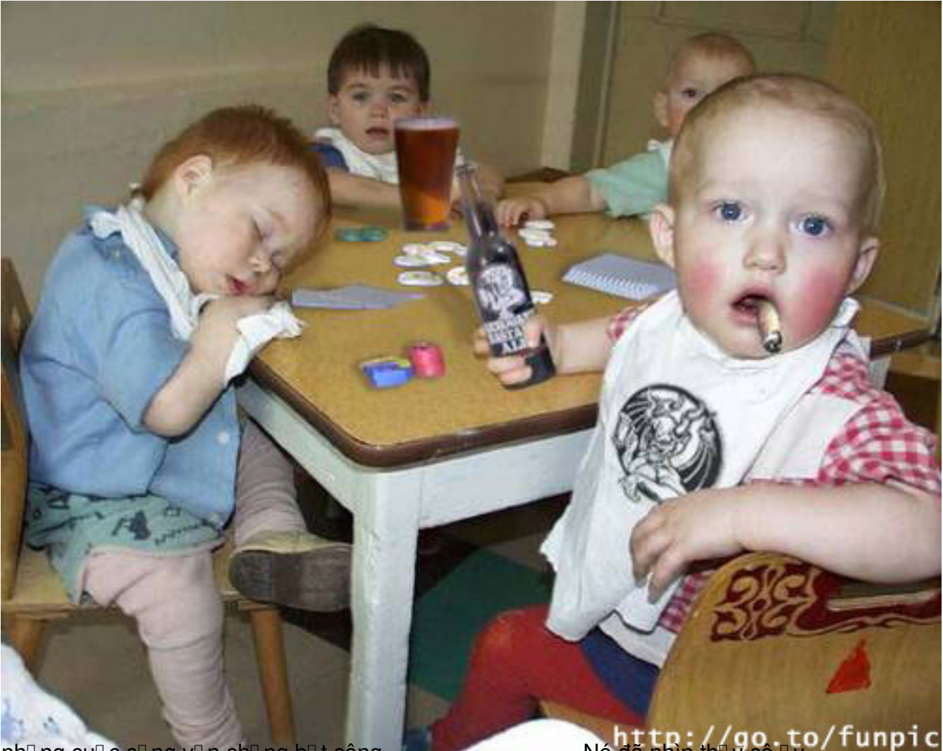
những cuộc sống vớ n chớ ng bớ t công ..... Nó đã nhìn thấy cô y .....

T&#225;c Gi&#7843;: chaunguyen..suutam.. .. Th&#7913; Ba, 01 Th&#225;ng 9 N&#259;m 2009 19:46