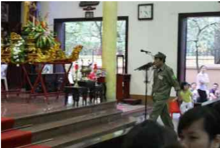
Ùa vào ch i b i b n linh m c và giáo dân

Đ/C Đ án: D vâng. Báo cáo th tr ng b n em đã làm đúng theo ph ng án A. Đã v n đ ng thuê m n đ c m t đám d diên d khùng làm qu n chúng t phát. Chúng nó ùa vào ch i b i b n linh m c và giáo dân i b i và không quên đ p phá vài th đ đ n m t b n chúng. Báo cáo, nói v kh năng ch i t c và i nói m t d y thì th a th tr ng, b n này thu c lo i siêu c c k đ y.