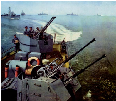
Biên đ i trên b n, b đ i tàu ch ng ng m c a h i quân ta