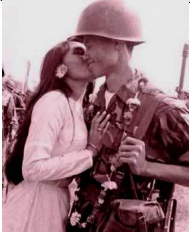
Vòng Hoa Chi n Th ng