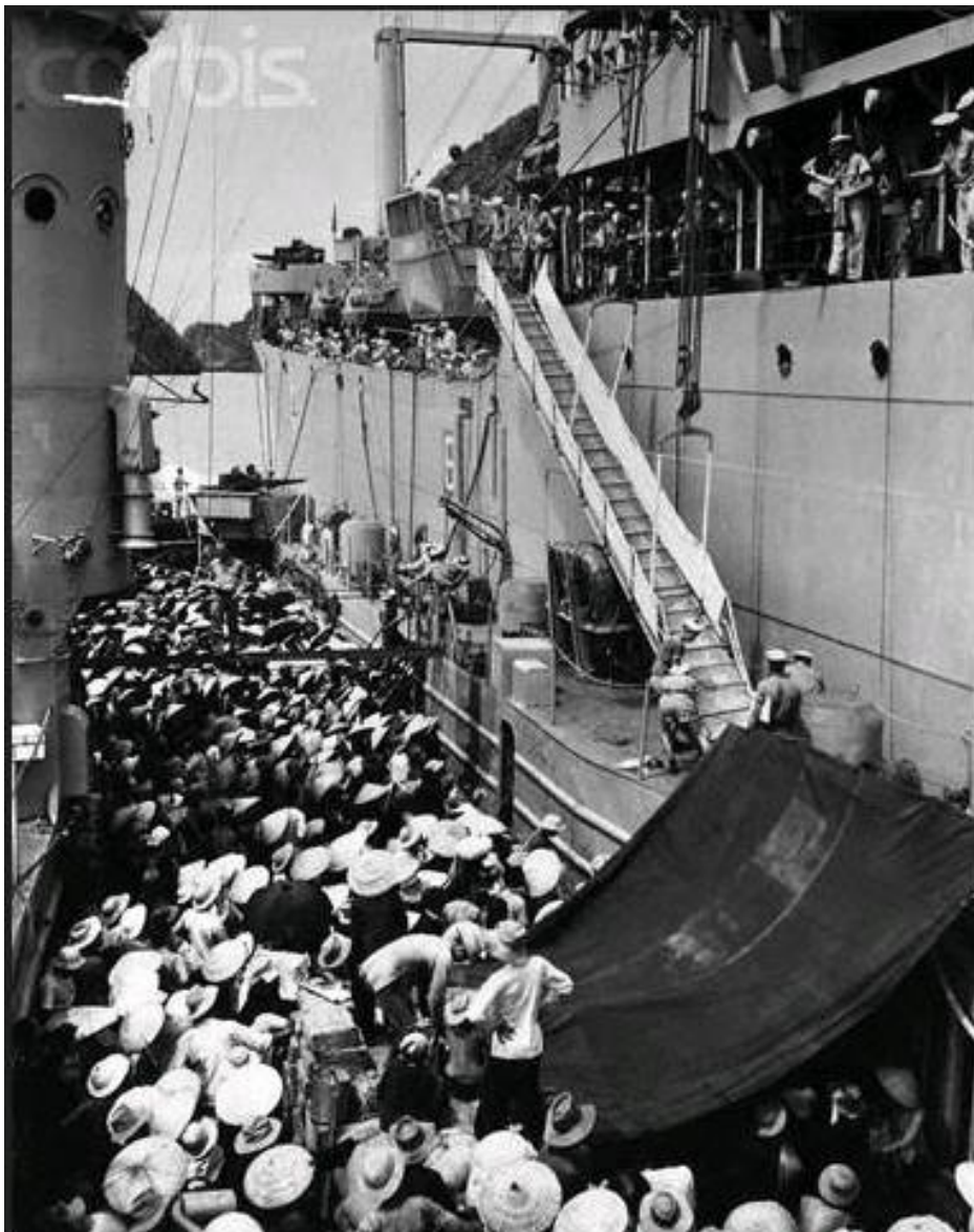
North Vietnamese refugees are being evacuated from Communist-held Haiphong to Saigon by US Navy ships. Here, the USS Montgigue (APA 210) lowers a ladder over the side to French LSM to take refugees aboard.1954

“Đ&#n tí phân r&#i nh&#t t&#ng ng&#n lá M&#i hòn than m&#u thóc cân ngô Hai tay ta gom góp đ&#ng c&# đ&#...”