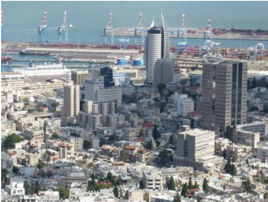
Hi&#225;c &#225;ng Haifa khu v&#225;c kinh t&#225; quan tr&#225;ng c&#225;a Israel.

V&#225; &#225;ch s&#225; đ&#225;o ph&#225;i truy&#225;n theo các ng&#225; i khai sáng đ&#225;o k&#225; ti&#225;p nhau. B&#225;t đ&#225;u là ông Siyyid Ali-Muhammad of Shiraz vào ngày 23 tháng 5, 1844 công b&#225; t&#225;i Shiraz n&#225;c Iran c&#225;ng l&#225;nh và h&#225; th&#225;ng t&#225; ch&#225;c c&#225;a đ&#225;o.