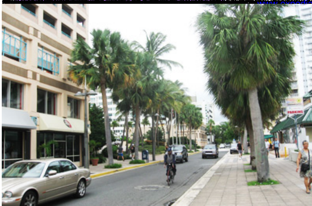
▣ L▣ trình chuy▣ n du ngo▣ n m▣ n Nam Caribbean.

Ti▣ n xe taxi t▣ phi tr▣ ng v▣ đây là 17 đô la. Du khách t▣ M▣ cũng không c▣ n đ▣ i ti▣ n vì đô la M▣ đ▣ c ch▣ p nh▣ n kh▣ p n▣ i trong vùng Caribbean. Ti▣ ng Anh đ▣ c s▣ d▣ ng kh▣ p n▣ i nên cũng đ▣ giao đ▣ ch. M▣ t ng▣ c nhiên cho chúng tôi là khách s▣ n có phòng li▣ n đ▣ chúng tôi ngh▣ ng▣ i sau m▣ t chuy▣ n bay h▣ i dài. Th▣ ng ít khi khách s▣ n có phòng tr▣ c 3 gi▣ tr▣ a. Ch▣ c mùa