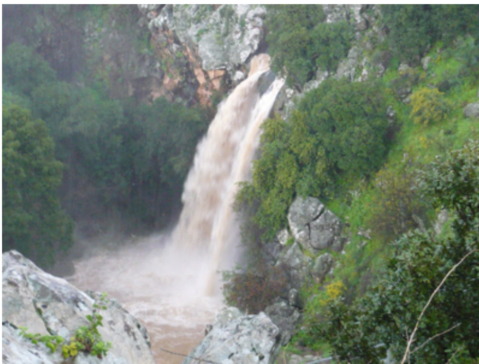
Thác n&#225;c trên cao nguyên Golan.

Golan có l&#225;ch s&#225; lâu đ&#225;i t&#225; th&#225;i thánh kinh đ&#225;c ghi chép và n&#225;i ti&#225;ng v&#225;i nhi&#225;u di tích kh&#225;o c&#225; đ&#225;ng th&#225;i cũng là đ&#225;a đ&#225;m du l&#225;ch thu hút khách thăm vi&#225;ng v&#225;i nhi&#225;u dòng su&#225;i, núi non và thác n&#225;c tuy&#225;t đ&#225;p.