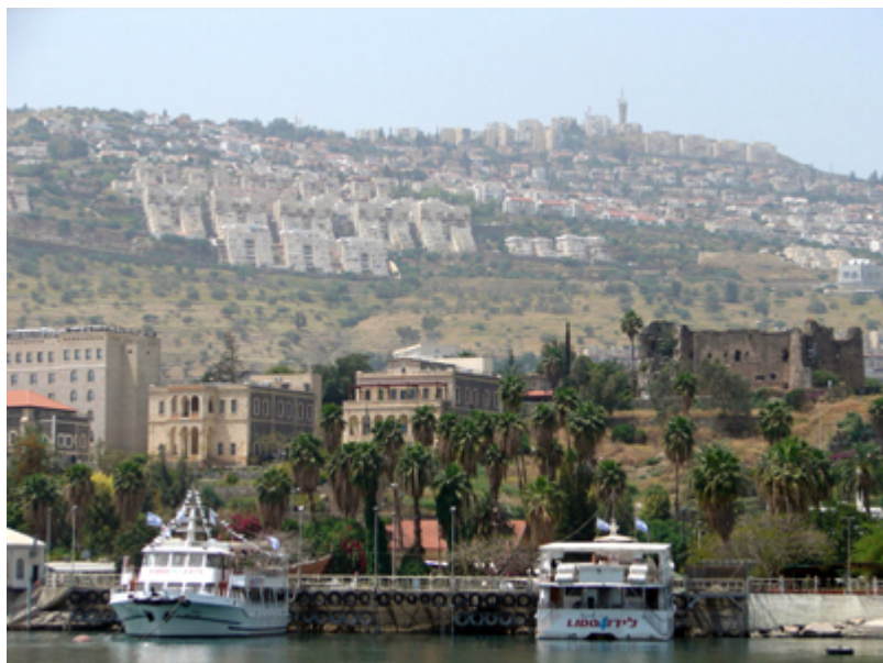
Thành phố Tiberias ở nh h Galilee

T&#225;c Gi&#7843;: Bài: Tr&#225;nh H&#225;o Tâm Th&#7913; S&#225;u, 06 Th&#225;ng 8 N&#259;m 2010 04:46