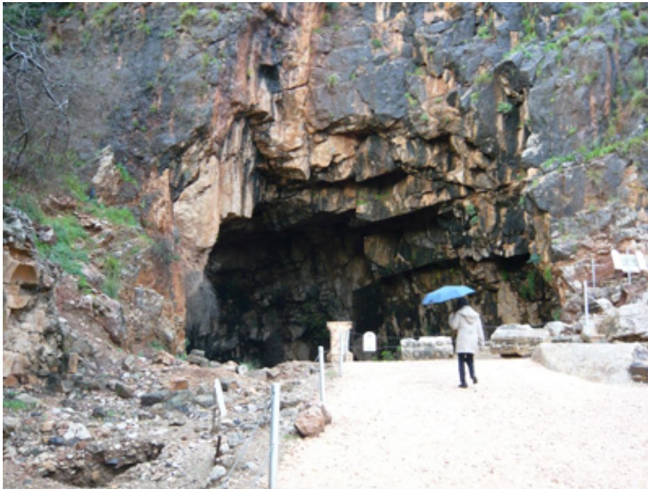
Đ&#225;ng Th&#225;n Pan trên cao nguyên Golan.

T&#225;c Gi&#7843;: Bài: Tr&#225;nh H&#225;o Tâm Th&#7913; S&#225;u, 06 Th&#225;ng 8 N&#259;m 2010 04:46